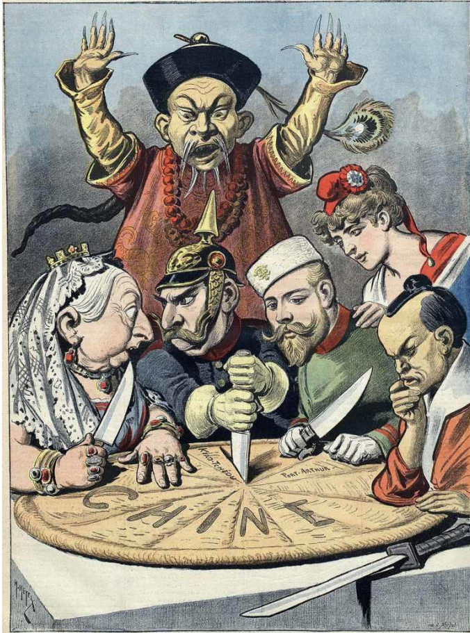
The Chinese cake (cartoon van Henri Meyer, 1898)

en een rationalistisch verlichtingsdenken waren de aanjagers van deze Westerse modernisering. Het waren ontwikkelingen die China voorbijgingen. De landbouw had er geen antwoord op de toenemende demografische druk wat tot relatieve verarming leidde. Op het platteland deden zich sociale spanningen voor, onder andere als gevolg van de immigratie van Han-Chinezen uit het noordoosten. Nijverheid en handel bleven werken volgens de beproefde methoden van voorheen en konden ook niet rekenen op veel ondersteuning vanuit het keizerlijke