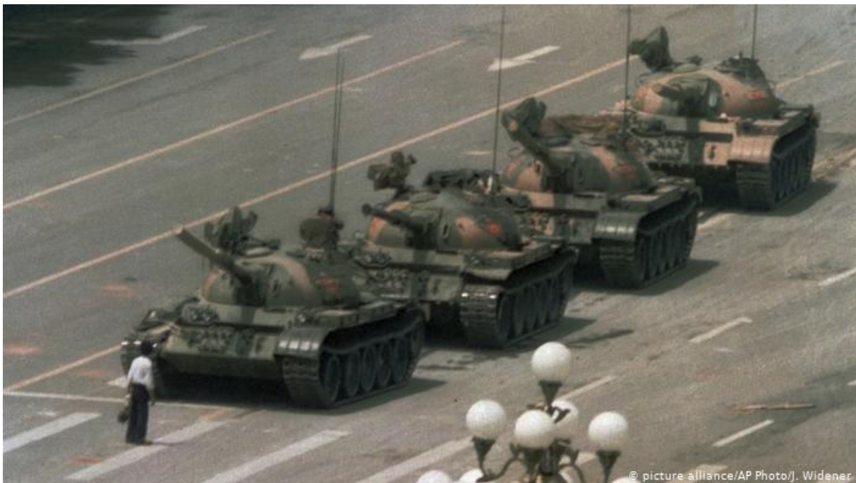
Het iconische beeld van de 'tankman' op het Tiananmen-plein in 1989.

De politiek van Deng sloot echter nog steeds aan bij de Chinese traditie om beslissingen centraal en van bovenaf aan de bevolking op te leggen. Dit blijkt ook uit de eenkindpolitiek (1979-2015) of de lancering van grote projecten zoals de Drieklovendam (1994-2006). Op het vlak van politiek en mensenrechten kwam er nauwelijks beweging. Integendeel, de partij hield de touwtjes stevig in handen. Nochtans had de voorzichtige liberalisering bij een jonge kritische elite hoge verwachtingen gewekt. Toen bleek dat partijfunctionarissen zich door de hervormingen hadden verrijkt, braken er in 1989 massale studentenprotesten uit. Op het Plein van de Hemelse Vrede (Tiananmenplein) werden wekenlang manifestaties georganiseerd tegen de corruptie en de beperking van de vrijheden. Het regime voelde zich hierdoor bedreigd en zette uiteindelijk het leger in tegen de jonge betogers. Het kwam tot een bloedige onderdrukking met een onbekend aantal doden en massale opsluitingen in heropvoedingskampen. Sindsdien zijn verwijzingen naar de gebeurtenissen van '1989' in China absoluut verboden.