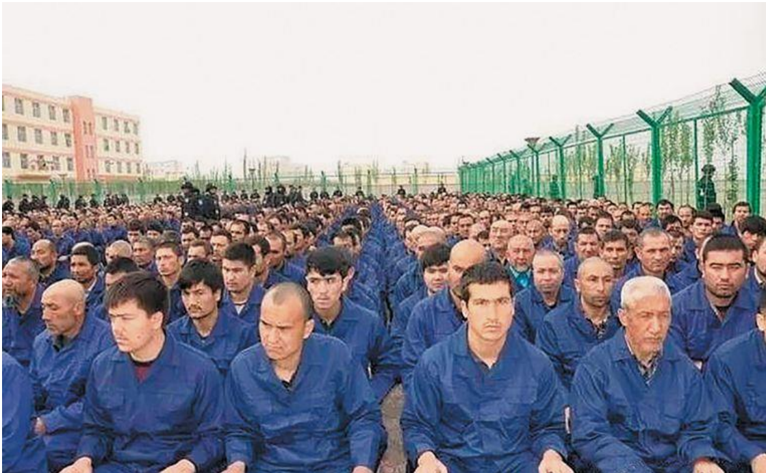
Mensenrechtenorganisaties en Westerse nieuwskanalen wijzen op de willekeur en de misbruiken tegen de Oeigoerse minderheid.

Het Chinese centralisme sluit even goed aan bij het communisme als bij de traditie van sterke keizerrijken. China beschouwt elk streven naar meer zelfbestuur in Tibet of Hongkong als een bedreiging voor de eenheidsstaat. Vroegere afspraken worden vaak op een zeer 'Chinese' manier geïnspireerd. Ondanks de afspraak 'Een land, twee systemen' blijft in Hongkong niet veel meer over van het toegekende statuut van 'Speciale Bestuurlijke regio'. Elk streven naar meer zelfstandigheid in Xinjiang, het woongebied van de Oeigoeren, wordt met harde hand bestreden. Veroordelingen door het Westen botsen in Peking op reacties van onbegrip en verontwaardiging over de inmenging van het buitenland in binnenlandse aangelegenheden.