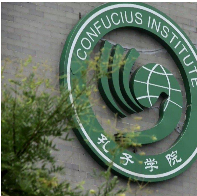
Het Confucius Institute verbonden aan de VUB sloot in 2019 zijn deuren.

China realiseert zich als marktkapitalistisch land zeer goed dat groei niet eeuwig en alleen via de binnenlandse markt kan komen. Sinds Xi Jinping heeft het land daarom zijn economische expansie naar het buitenland voortdurend opgedreven. Aanvankelijk gebeurde dit nog in continenten waarvoor het Westen in het verleden weinig aandacht betoonde, vervolgens in enkele noodlijdende landen van Zuid-Europa (Griekenland, Cyprus,...), en recent ook in Oost-Europa. Sinds 2016 probeert China om via het Belt & Road Initiative , ook bekend als de Nieuwe Zijderoute, controle te krijgen over de Euraziatische ruimte. Heel wat landen laten zich verleiden door dit ambitieuze programma van investeringen in infrastructuur (wegen, spoorwegen, havens, energie,...). Deze politiek van ‘soft power’ neemt heel wat vormen aan. Tijdens het voorbije coronajaar waren er de leveringen van mondmaskers, gevolgd door het Chinese vaccin Sinovac dat in vele landen wordt aangeboden, en in mei 2021 was er de belofte om de patentrechten van hetzelfde vaccin vrij te geven aan lokale producenten. De boodschap die hiermee naar de rest van de wereld wordt uitgestuurd is hierbij minstens even belangrijk als de effectieve uitvoering van deze Chinese ‘hulp’. Peking laat in elk geval geen gelegenheid voorbijgaan